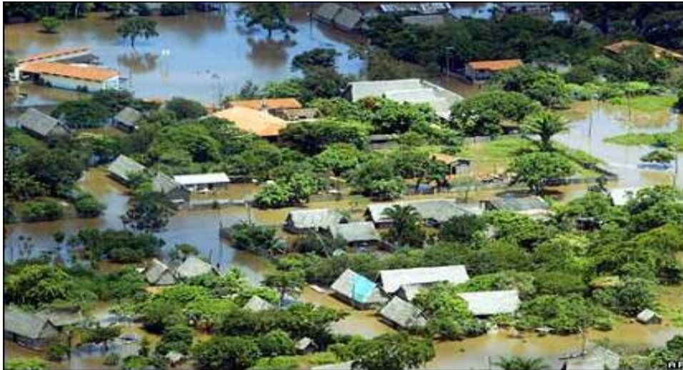
Trinidad - febrero 2008

Otros efectos se han dado por los estragos del fenómeno de El Niño y La Niña, con inundaciones en algunas zonas, sequías en otras y variaciones climáticas en todas.