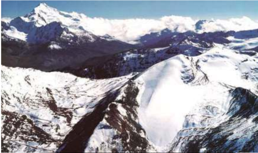
Nevado Chacaltaya 1997

En los últimos años se ha sentido con mayor fuerza los efectos del cambio climático en Bolivia, por un lado con el deshielo de algunos nevados como el del Chacaltaya, que en 1998 se anuncio su desaparición en 15 años o más.