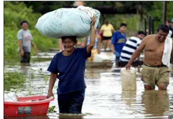
Las peores inundaciones en 25 años. Más de 3.500 personas afectadas

Los efectos a largo plazo han sido la escases de algunos productos como el aceite y harina, además del alza de precios en muchos otros, como la carne de pollo y res, el arroz, azúcar y pan.