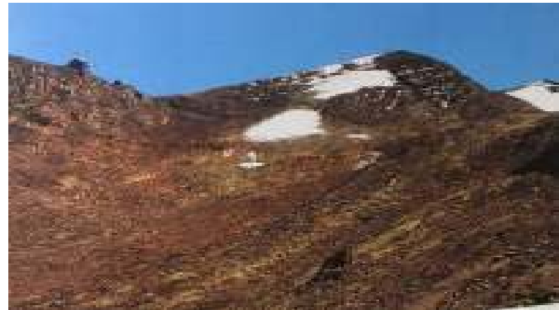
Nevado Chacaltaya 2007

Sin embargo su derretimiento por efectos del calentamiento global ha sido acelerado. De continuar el deshielo de nuestros nevados sentiremos escases de agua para consumo humano, agricultura y generación de energía eléctrica.